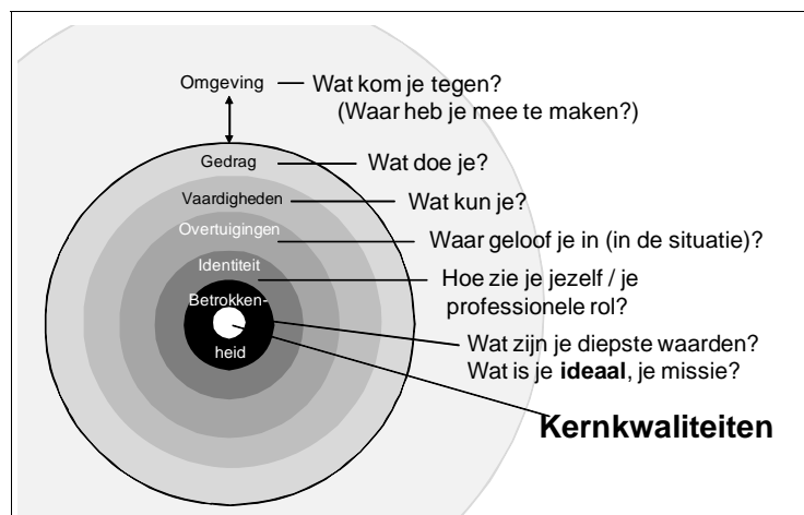
Figuur 3. Het ui-model.

Het bekende ui-model (figuur 3) maakt dit inzichtelijk: gedragsgerichte reflectie blijft aan de buitenkant van de ui. Door aandacht te besteden aan de lagen van vaardigheden, maar vooral aan overtuigingen, identiteitsopvattingen en idealen/drijfveren van de leraar wint de reflectie aan kracht en kan een diepgaander leerproces ontstaan.